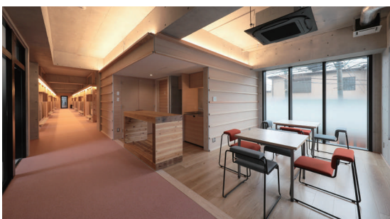
教員と学生の新しい交流の場として描くフロアにあるラウンジを設置