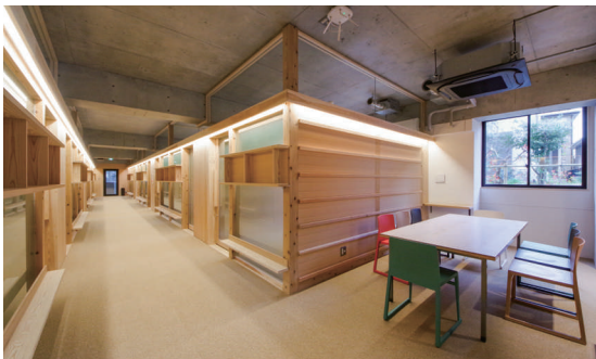
ラウンジに隣接したミーティングスペース