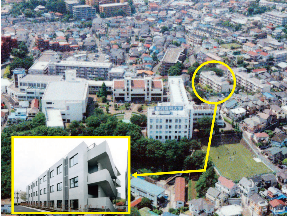
新研究棟は丘の上の眺望を活かした南側と北側に開かれた設計になっており、近隣や1~7号館とのつながりを考えた配置となります。